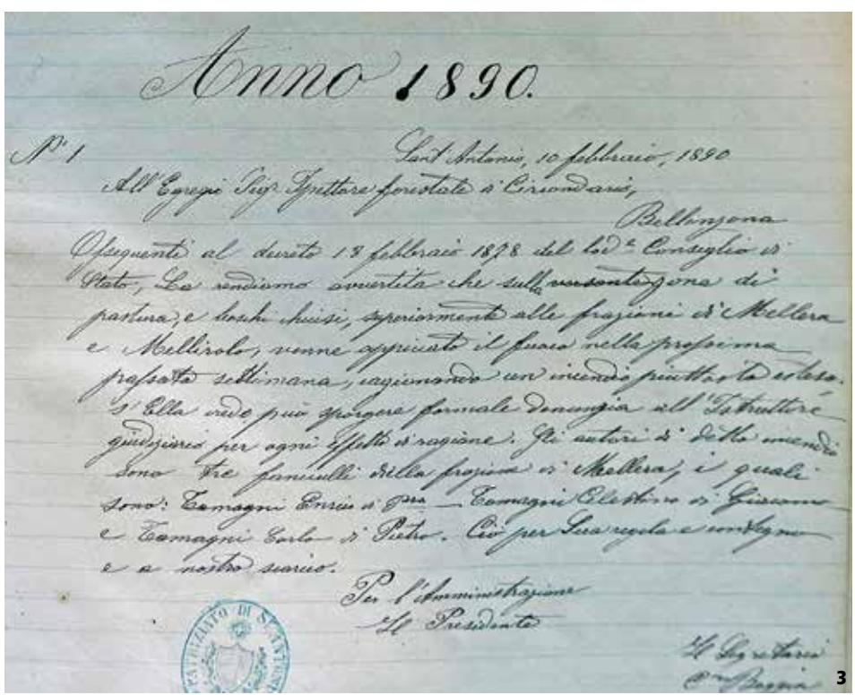
Nota 1. Archivio "Copia Lettere" del Patriziato di Sant'Antonio, 10 febbraio 1890.

acri a Two Rocks, località situata a una decina di chilometri da Petaluma. In totale divenne proprietario di 625 acri sui quali costruì una diga e creò una riserva di acqua. Nel 1926 vendette tutte le sue proprietà e si ritirò definitivamente a Two Rocks, dove acquistò altri duecento acri di terreno e impiantò un allevamento di galline. Nel 1938 rientrò nel business della ristorazione inaugurando con una grande festa il nuovo ristorante Horseshoe al 403 di Washington Street. Nel 1941 la sua salute peggiorò. Ricoverato all'ospedale di Santa Rosa, vi morì undici anni dopo, il 18 gennaio 1952.